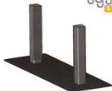
Platine intérieure [2 perçages de fixation]