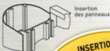
Insertion des panneaux

Les totems Rondo et Rondo Medium vous offrent un large choix de formats standards.